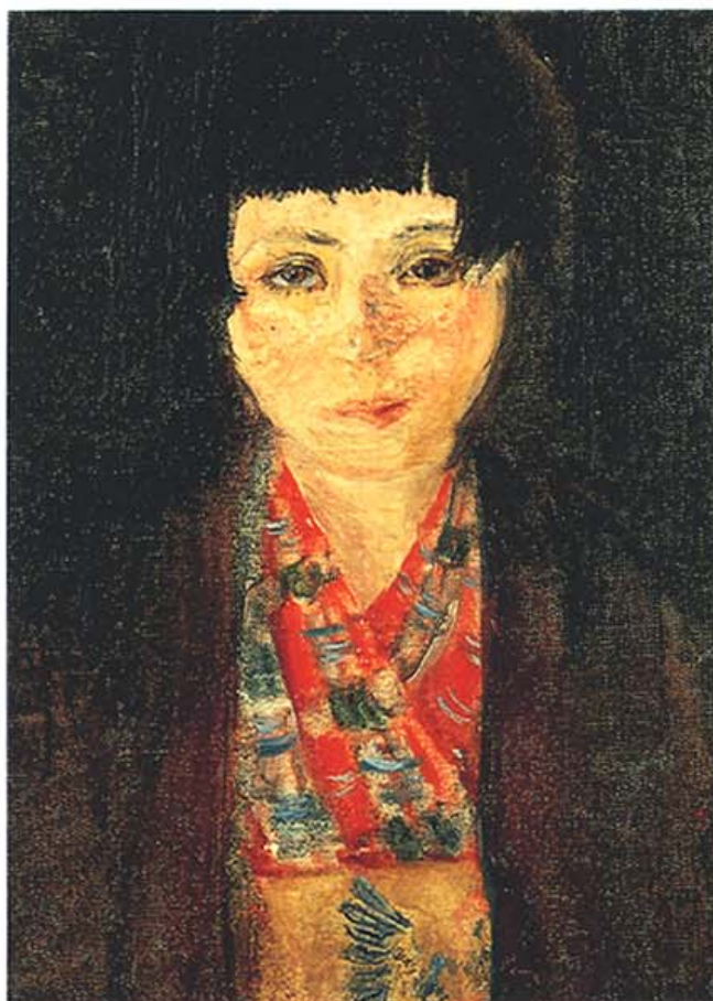
「自画像」1925年制作 30.5×22.0cm 油彩・キャンバス 尾西市三岸節子記念美術館蔵

1925年、当時20歳で長女を出産した直後に発表された作品である。春陽会第3回展に初出品したこの作品は初入選を果たし事実上画壇へのデビュー作となった。今日とは違い女性が認められることは非常に難しい時代であったにも関わらず、不屈の精神と強靱な意志により女性油絵画家の先駆者たる道を築いた彼女の発表した「自画像」は、これ一点のみである。正面を見据えた眼差しは、妻として、母として、そして画家として生きていくこれからの人生に対する彼女の固い決意の現われと同時に迷いも混在しているようである。黒に近い背景から目に飛び込んでくる明るい衣服の色は、後に色彩豊かな数多くの作品を生み出した彼女の作品の傾向を覗かせるものである。静物・風景画については多くの作品を残している中で、これは彼女の希少な人物画といえる。今日でも、精力的に活動を続ける彼女の原点にふさわしいといえる作品ではないだろうか。